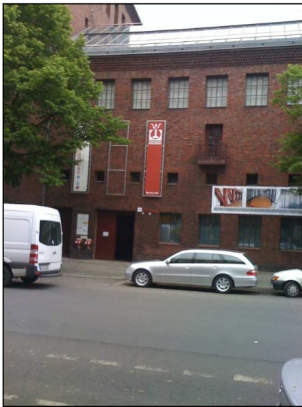
Abbildung 3 – Außenansicht