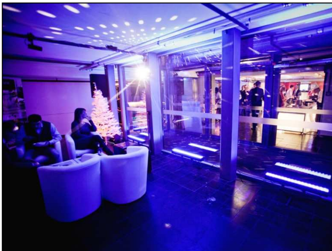
Abbildung 5 – Bar