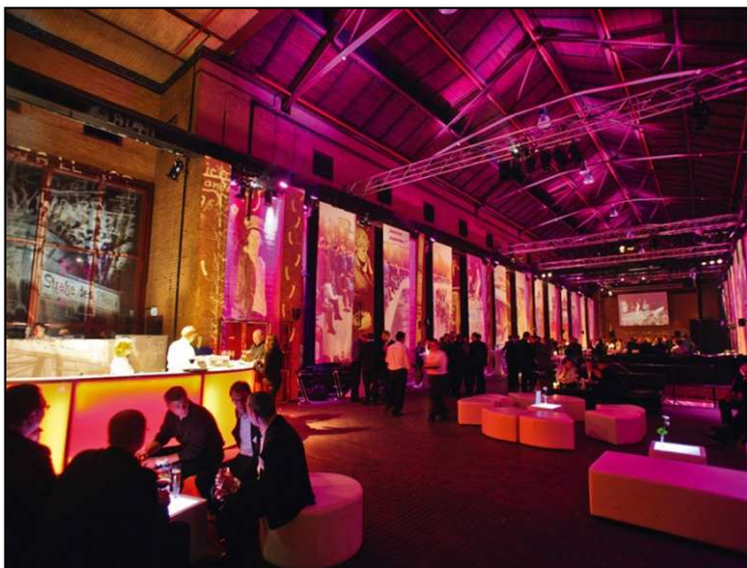
Abbildung 4 – Alte Generatorenhalle